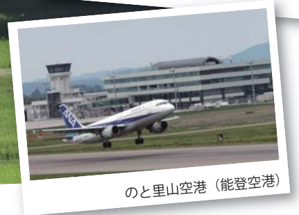
のと里山空港（能登空港）